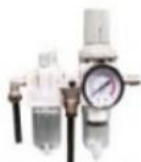
Oro srauto reguliatorius su filtru ir tepaline